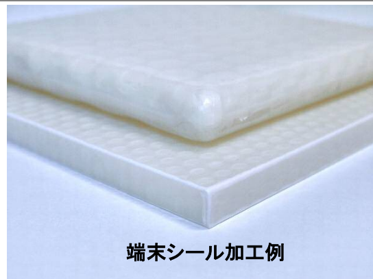
端末シール加工例